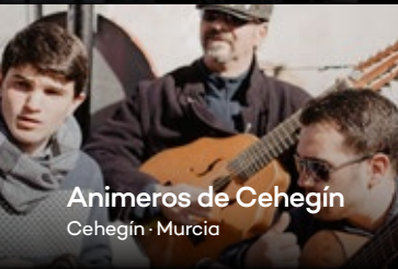
Animeros de Cehegín Cehegín · Murcia