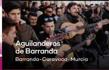
Aguilanderos de Barranda Barranda-Caravaca · Murcia