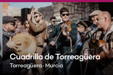
Cuadrilla de Torreagüera Torreagüera · Murcia