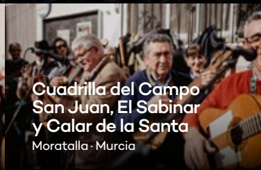
Cuadrilla del Campo San Juan, El Sabinar y Calar de la Santa Moratalla · Murcia