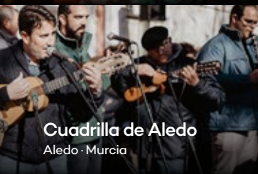
Cuadrilla de Aledo Aledo · Murcia