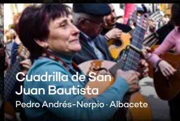
Cuadrilla de San Juan Bautista Pedro Andrés-Nerpio · Albacete