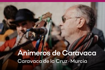
Animeros de Caravaca Caravaca de la Cruz · Murcia