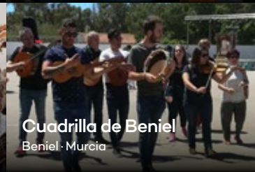
Cuadrilla de Beniel Beniel · Murcia