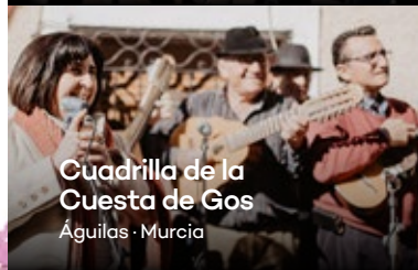
Cuadrilla de la Cuesta de Gos Águilas · Murcia