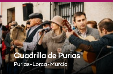
Cuadrilla de Purias Purias-Lorca · Murcia